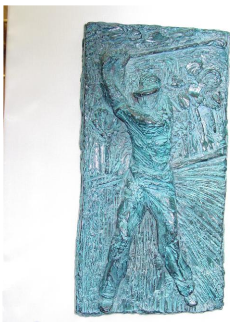
Trophée Céleste 2008