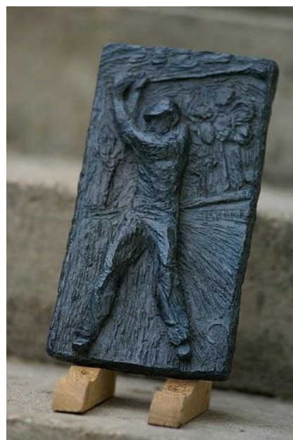
Trophée Céleste 2010

Particularité du trophée : sa couleur changeante qui selon la sensibilité du fondeur varie d'un bronze à l'autre. D'un bleu tirant presque sur le vert à un bleu profond ces variations confèrent à chaque trophée une particularité qui en fait une œuvre unique.